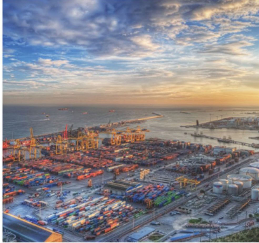
Limanlar & Petrokimya Tesisleri